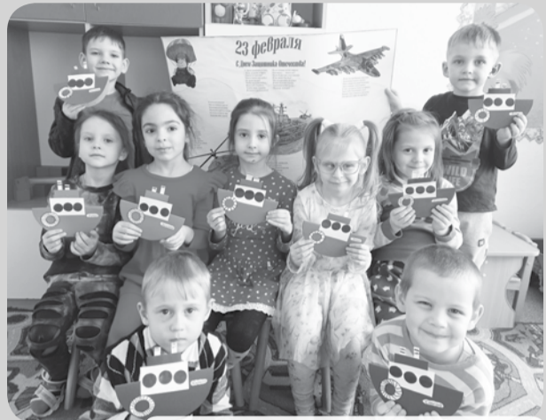
В ходе одного из мероприятий детского сада.

С большим интересом и любовью ребята изготовили подарки для любимых пап, дедушек и братьев, выпустили стенгазету. Кроме того, с помощью взрослых написали письма и нарисовали рисунки со словами поддержки и поздравлениями солдатам, находящимся сейчас в зоне СВО.