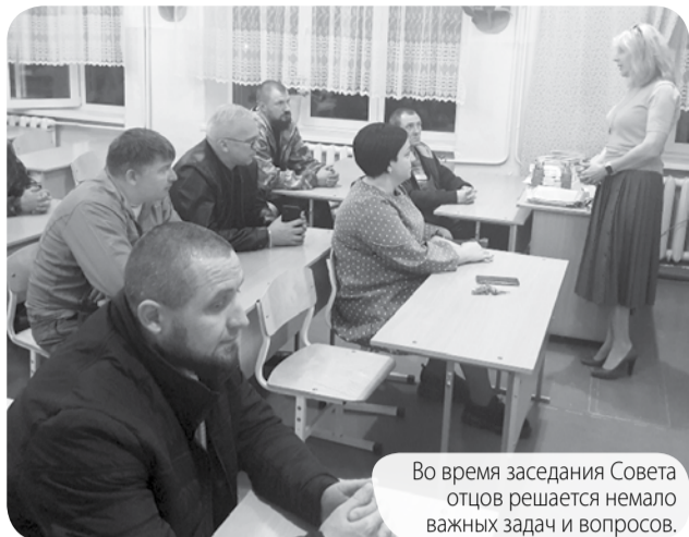
Во время заседания Совета отцов решается немало важных задач и вопросов.

Одной из форм системы государственно-общественного управления является Совет отцов. В школе №5 села Новоблагодарного такой Совет действует уже несколько лет. Он создан для укрепления связи семьи и школы в воспитании, обучении и развитии детей, но особую роль играет в профилактике социально-негативных проявлений среди обучающихся.