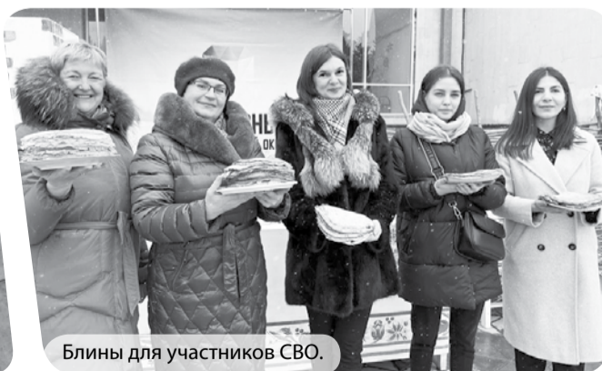
Блины для участников СВО.

службе АПМО, в округе на постоянной основе проходят различные акции, направленные на поддержку